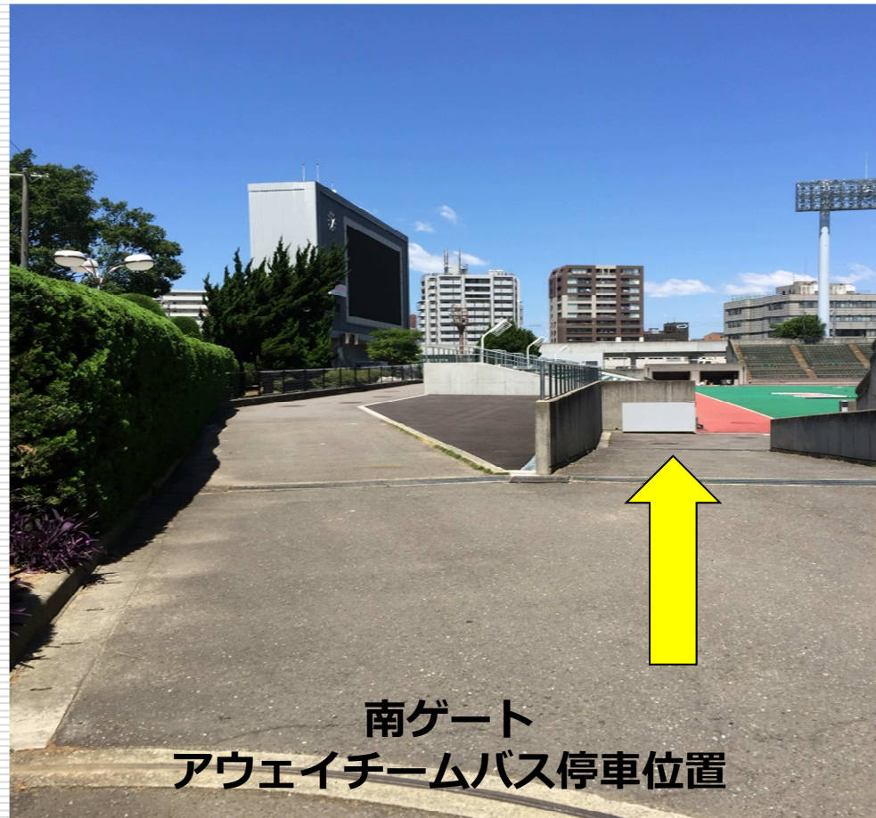
南ゲート アウェイチームバス停車位置