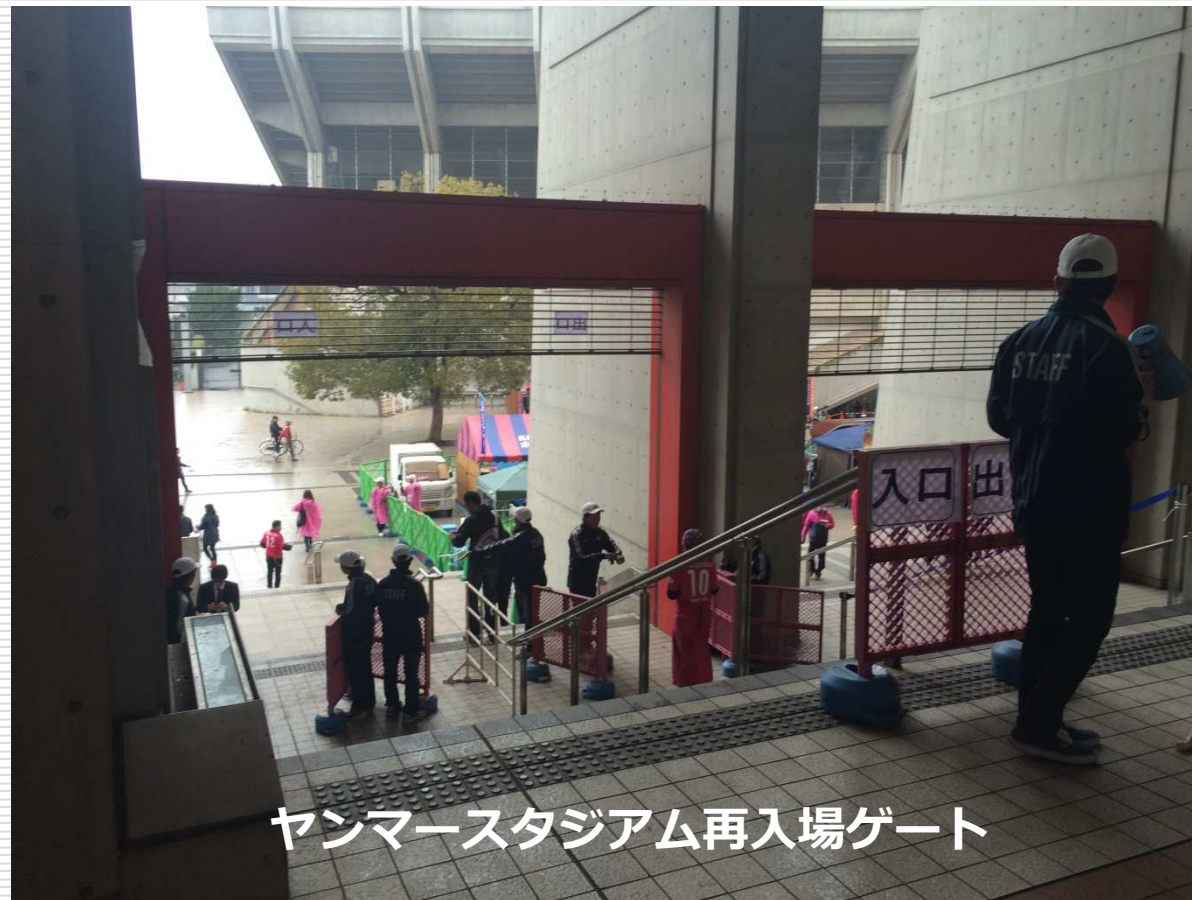
ヤンマースタジアム再入場ゲート