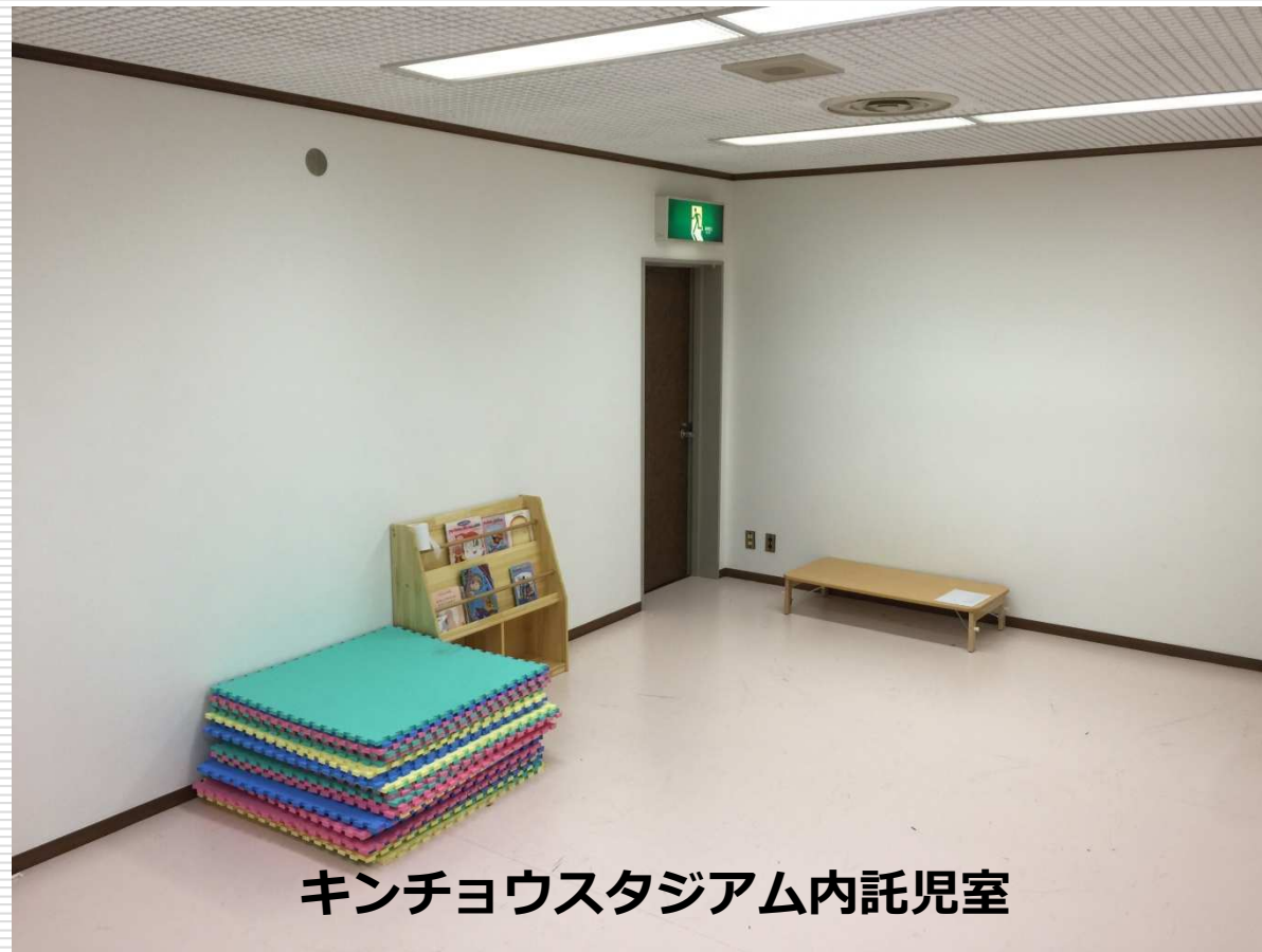
キンチョウスタジアム内託児室